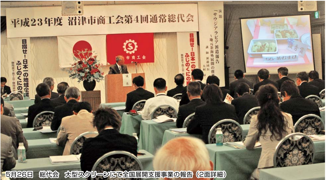
5月26日 総代会 大型スクリーンにて全国展開支援事業の報告 (2面詳細)

No. 40 発行者 沼津市商工会 会長 松永公良 〈本所・原支所〉沼津市原1200番地の1 TEL (055) 966-1331 FAX (055) 967-4925 〈戸田支所〉沼津市戸田1028番地の5 TEL (0558) 94-2224 FAX (0558) 94-4029 編集 沼津市商工会広報委員会