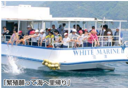
「繁殖願って海へ里帰り」

ところで、高足ガニと同様に児童の人数も年々少なくなっているのが気になります。今後たくさんさんの卵が孵化し大きく育って戻って来てくれることを願いました。